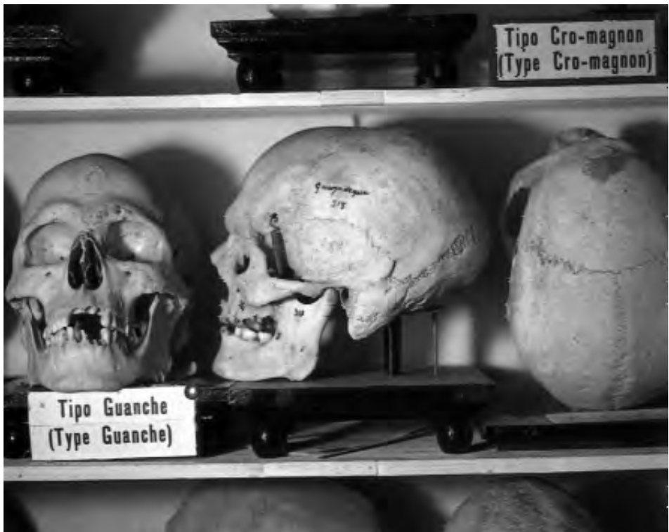
Cráneo tipo guanche del Museo Canario.

Especímenes científicos y souvenirs turísticos conforman un continuum , reflejando ambos más la cultura de quienes los recolectaron o los adquirieron que los lugares y las gentes a las que pertenecieron o representan. Es significativo que el museo y sus colecciones hayan servido en la modernidad para legitimar la frontera entre recolección científica de lugares y culturas exóticas y los banales souvenirs que los turistas adquieren en esos lugares y de esas culturas.