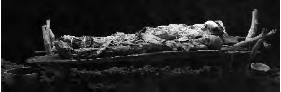
Dos momias guanches.

No se puede perder de vista que las actuales políticas de restitución cultural coinciden en el tiempo con la crítica radical, no sólo a las formas de apropiación cultural, sino sobre todo a las formas de representación de las otras culturas en los museos occidentales. En un mundo multicultural, multiétnico, los museos occidentales están “levantando” todas las viejas exposiciones y renunciando a autootorgarse el derecho de representar a los “otros”. El resultado, provisional, es la retirada progresiva de las colecciones etnográficas y su recontextualización selectiva de sólo aquellos objetos que, desde la perspectiva occidental, tienen una dimensión estética. La reciente creación del museo del Quai Branly en París, que sólo alberga los objetos de arte de las antiguas colecciones del Museo del Hombre, es quizás la más genuina expresión de esta tendencia. Así que, hoy, los millones de objetos de las culturas de todo el mundo atesorados en los museos se han convertido en una fastidiosa carga, tras el largo periodo moderno en que fueran la expresión del dominio, la riqueza y el patrimonio de las metrópolis coloniales y sirvieran para el disfrute de su público. Son, más que nunca, objetos muertos. No es casual entonces que sea ahora y no hace unas décadas, cuando las demandas de restitución del patrimonio cultural –no artístico– sean acogidas con más simpatía y más rápidamente atendidas.