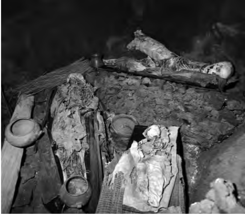
Momias del Museo Canario.

más socorridas es la de establecer una clara dicotomía entre los que viajan por motivos científicos y los que viajan por ocio. De esta dicotomía siempre ha resultado que los viajeros científicos son vistos como personajes interesantes y dignos de estudio, mientras que a los otros, los turistas, generalmente se les presenta como seres anodinos de los que no vale la pena indagar en sus motivaciones y comportamientos. Como resultado de esta radical distinción, los correlatos materiales de unos y otros, esto es, las colecciones científicas de objetos recolectados en las expediciones y los souvenirs adquiridos por los turistas, son presentados como dos clases de objetos sustancialmente diferentes. Pero es difícil mantener