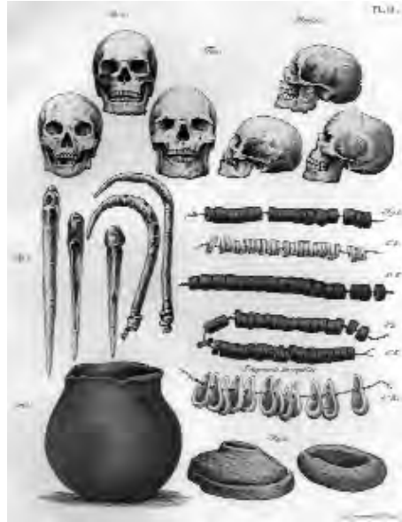
Lámina de la obra de Sabin Berthelot Antiquités canariennes .

Los restos humanos de los aborígenes canarios representan, por antonomasia, a toda la variedad de objetos arqueológicos y etnográficos que tanto han apasionado a exploradores, científicos y turistas. Los restos de los aborígenes, y de modo particularmente significativo, las momias, han sido los “objetos” más valorados como especímenes de colección y de los que más han servido de vehículo de la fascinación de los viajeros. De tal modo que las momias guanches han respondido a muy diferentes propósitos en distintas épocas: como remedios medicinales, rarezas y curiosidades, ejemplares antropológicos, evidencias científicas, piezas de museo... Las momias guanches, repartidas por muchos museos de Europa y América y en un indeterminado número de colecciones privadas, han sido sucesiva o simultáneamente trofeos de conquista colonial, remedio medi-